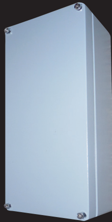
Aluminium-Gehäuse Typ: CA-310