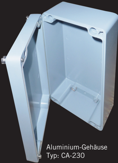
Aluminium-Gehäuse Typ: CA-230