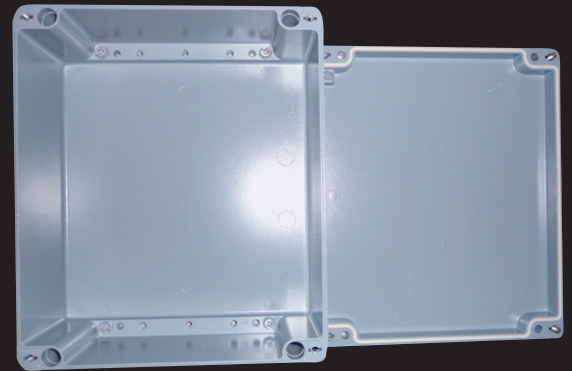
Aluminium-Gehäuse Typ: CA-370

Unter www.wittwer.com finden Sie in der Rubrik Vertriebsprogramm eine Übersicht unserer Standardgehäuse.